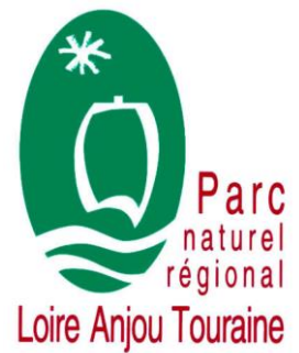
Schéma régional d'aménagement, de développement durable et d'égalité des territoires

Les Schémas régionaux d'aménagement, de développement durable et d'égalité des territoires (SRADDET) renforcent la place de la région dans la planification territoriale et jouent un rôle stratégique. Ce document de planification porte sur de nombreux sujets, dont la protection et la restauration de la biodiversité. Il se substitue à de nombreux schémas sectoriels, dont le Schéma régional de cohérence écologique (SRCE).