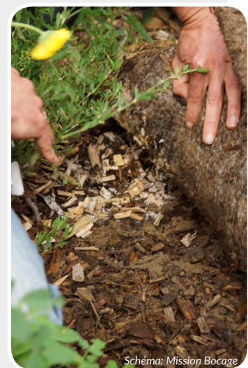
Schéma: Mission Bocage

Ceux-ci ont une action de bioturbation, de fragmentation de la matière organique, de remontée d'éléments minéraux présents en profondeur, notamment le calcium, de formation d'agrégat par déjection (turicule). L'action de la microflore (bactérie, champignon, algues) est favorisée par l'aération du sol, augmentant l'humification et la minéralisation. En bonne condition de richesse en matière organique, l'action mécanique (labour) assurerait environ 25% de ce rôle tandis que les lombrics 50%.