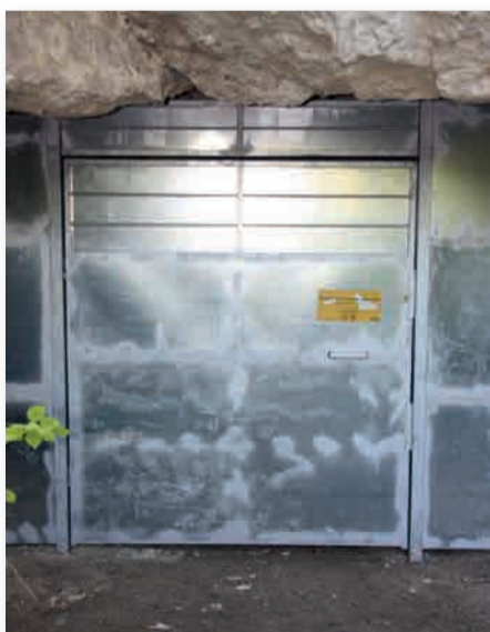
Grilles et portails permettent de limiter le dérangement des chauves-souris

Le Parc a financé en 2012 la pose de 5 systèmes de protection de gîtes à chauves-souris. Ces portails ou grilles sont installés la plupart du temps chez des particuliers à l'entrée de cavités. Ils permettent de réduire les nuisances pour ces mammifères, notamment lors de la période cruciale de l'hibernation. L'installation est précédée de la signature d'une convention qui régit les pratiques offrant une protection optimale pour les chauves-souris.