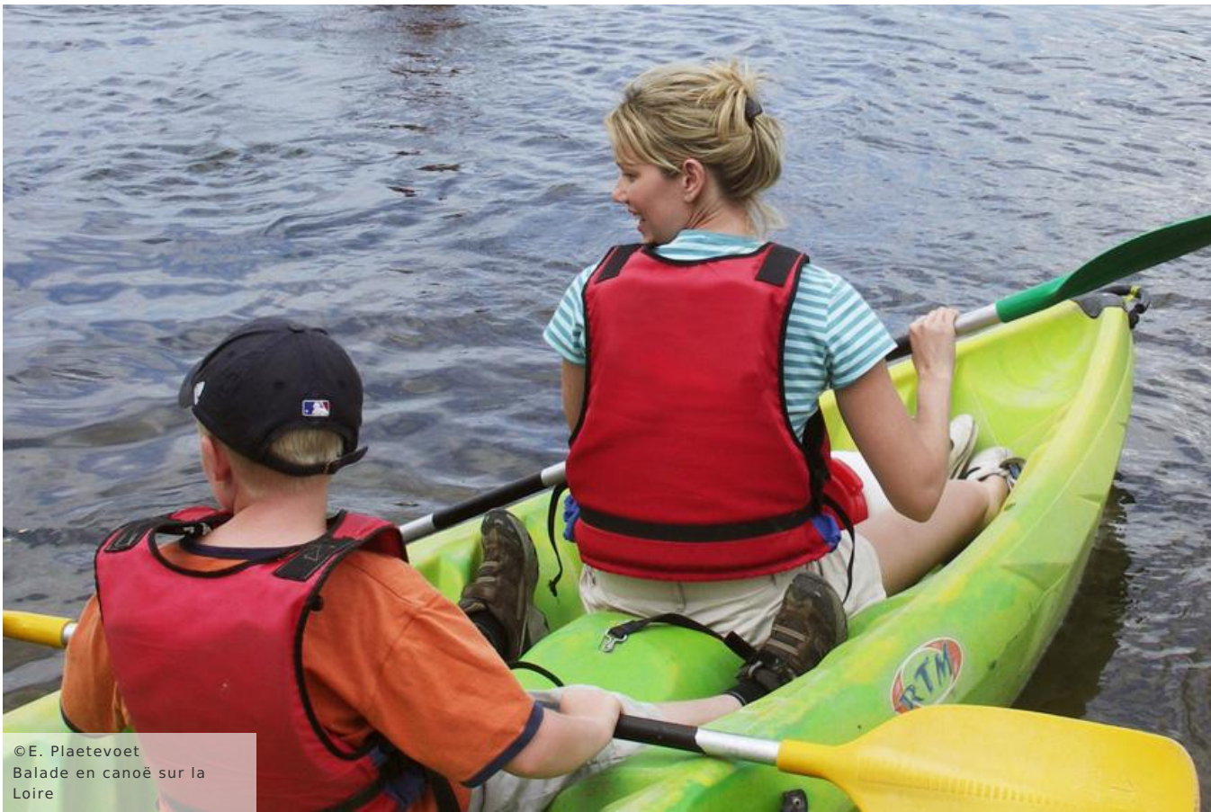
Balade en canoë sur la Loire