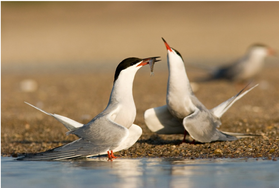
Sternes pierregarin