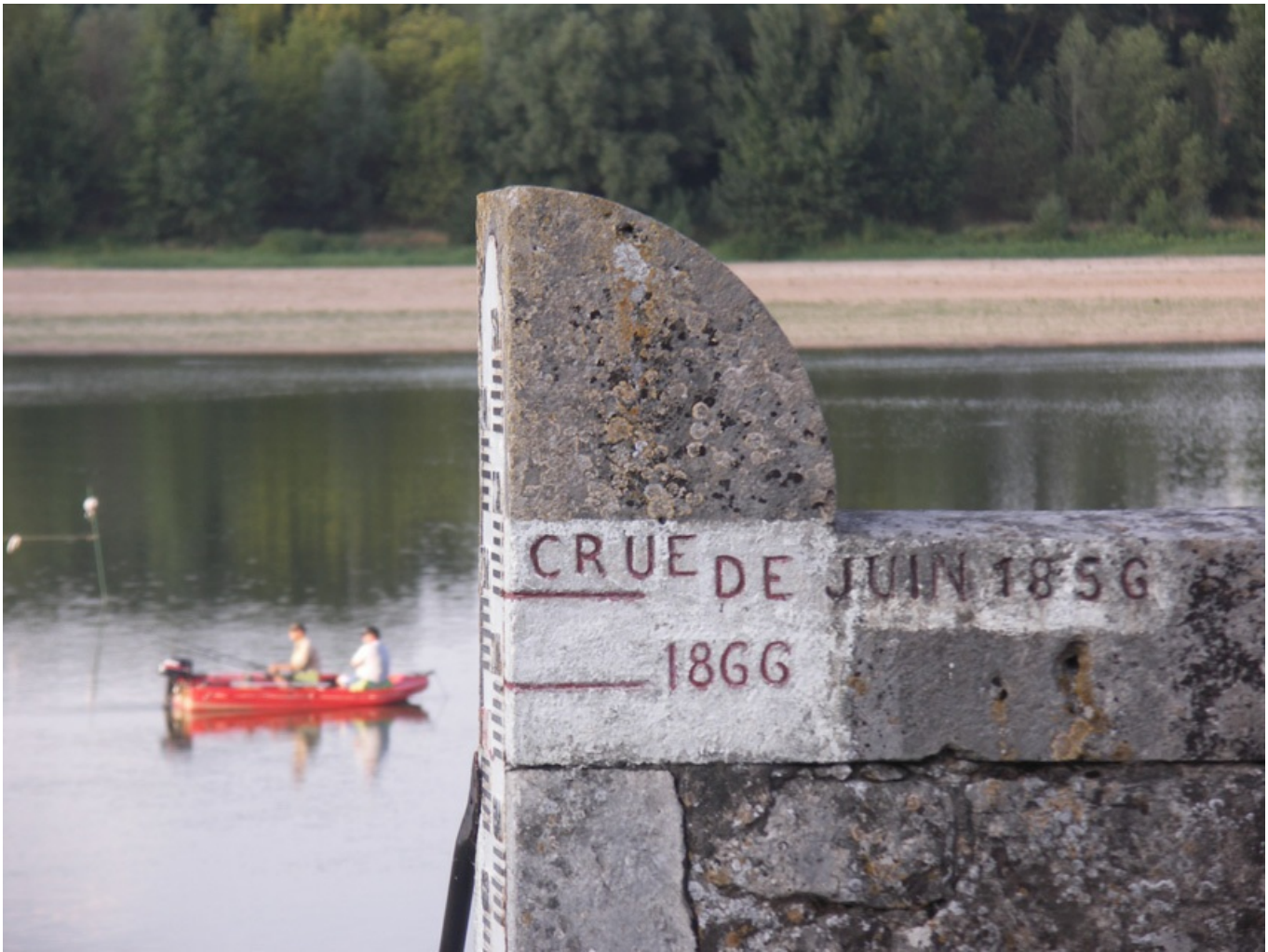
échelle de crue en bord de Loire