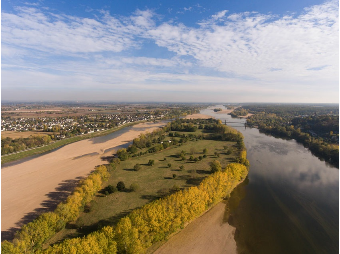
vue sur l'île de Gennes. Faible niveau d'eau en période estivale

Dans ce contexte, les travaux de restauration des boires de Loire, les aménagements destinés à réguler le débit des différentes rivières et l'attention portée à l'équilibre des écosystèmes seront cruciaux pour assurer une gestion durable de la ressource en eau.