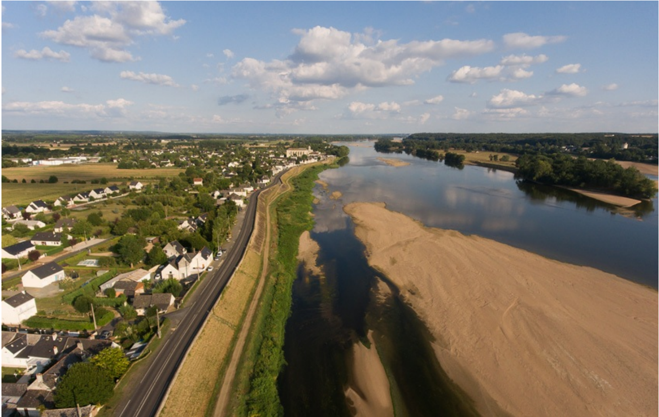
La levée de la Loire, au fond la commune de Saint-Clément-des-Levées

départements d'Indre-et-Loire et de Maine-et-Loire ont entrepris des travaux d'entretien et de confortement pour améliorer la sécurité des digues, et donc de ses riverains.