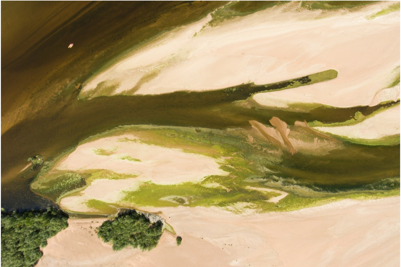
banc de sable en Loire

animales. Leur assèchement menace directement la faune et la flore. Des travaux de restauration des boires ont donc été entrepris et les épis de navigation ont été en partie arasés entre Les-Ponts-de-Cé et Chalonnes (2009), pour permettre à ces écosystèmes de retrouver leur équilibre.