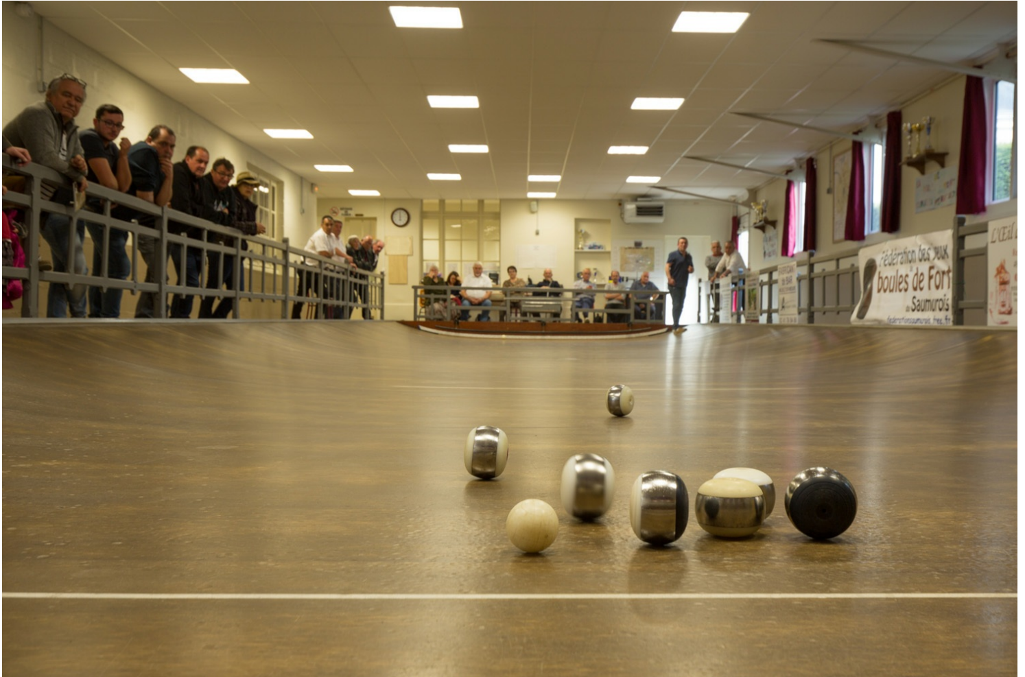
Boule de fort

Le but de ce jeu ? Rapprocher les boules le plus près possible du « maître », l'équivalent du cochonnet à la pétanque, sur une piste incurvée et très roulante. Pour corser le tout, la boule a un centre de gravité décalé, son côté « fort », et n'a donc jamais une trajectoire rectiligne !