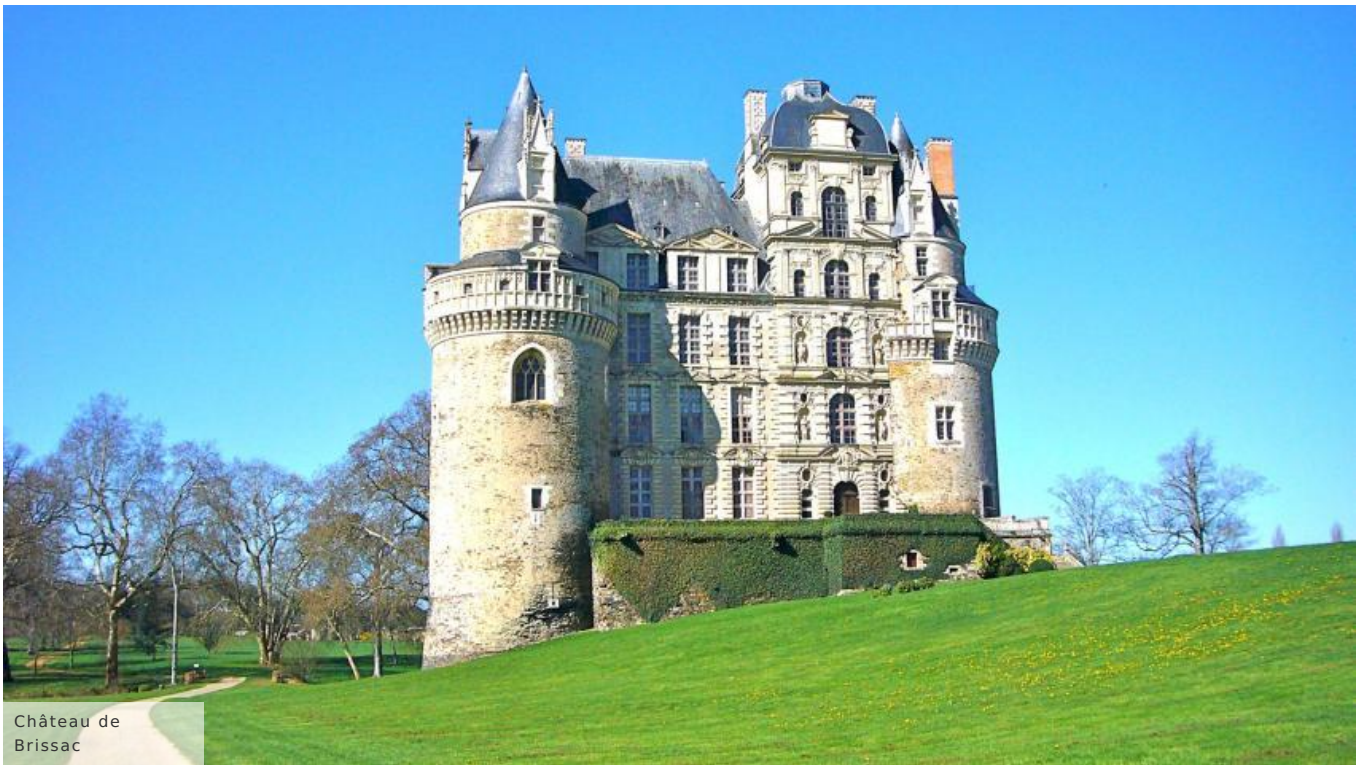
Château de Brissac