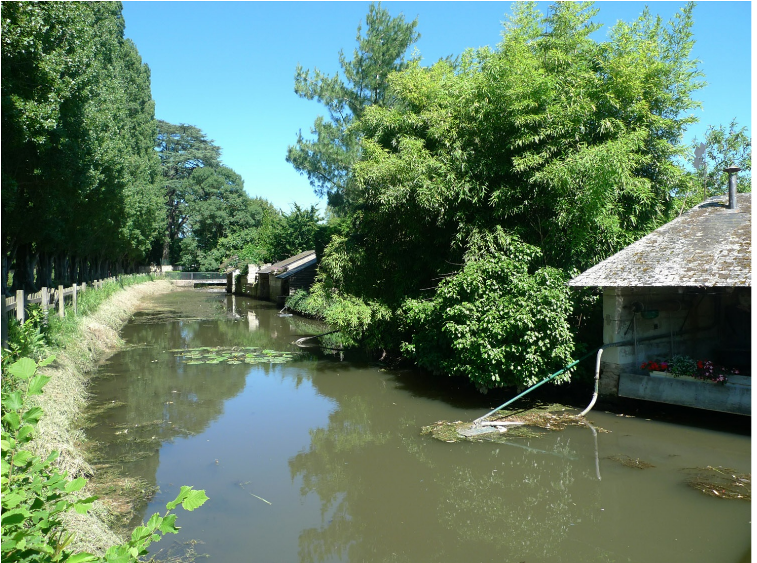
Promenade des lavoirs

Autre singularité de cette ville d'eau : une quantité étonnante de lavoirs privés jalonnent la promenade des lavoirs, pittoresque et ombragée. Couverts d'une charpente en appentis, ils ont la particularité d'être équipés d'un astucieux plancher amovible qui permettaient aux lavandières de laver le linge quel que soit le niveau d'eau de la rivière. Luxe suprême, certains lavoirs étaient même dotés d'un équipement qui permettait de faire chauffer de l'eau !