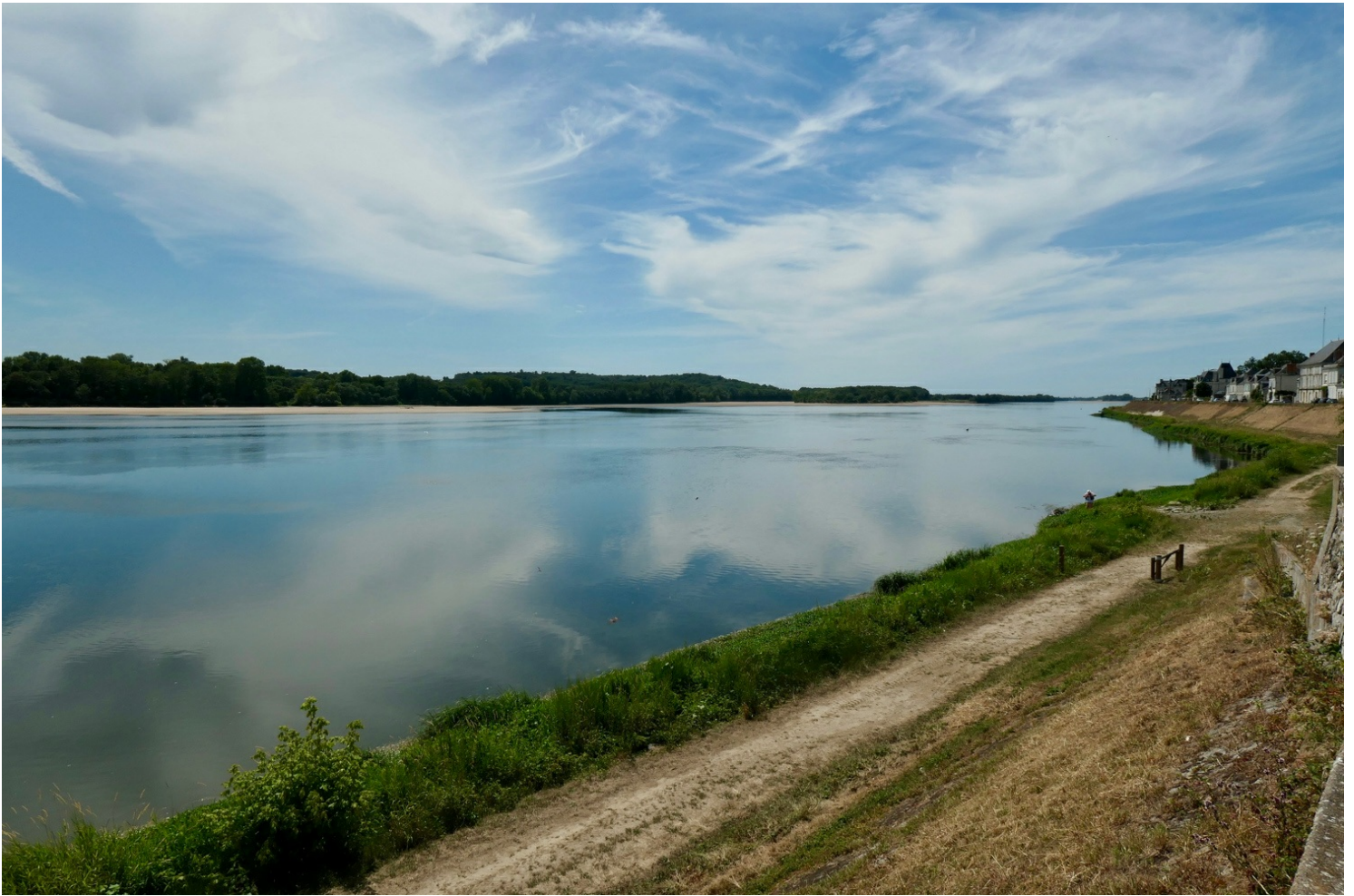
Loire à Saint-Mathurin-sur-Loire