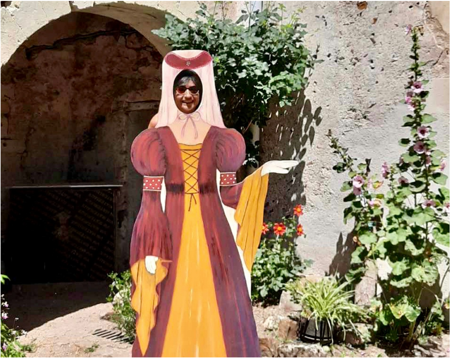
Séance photo au prieuré