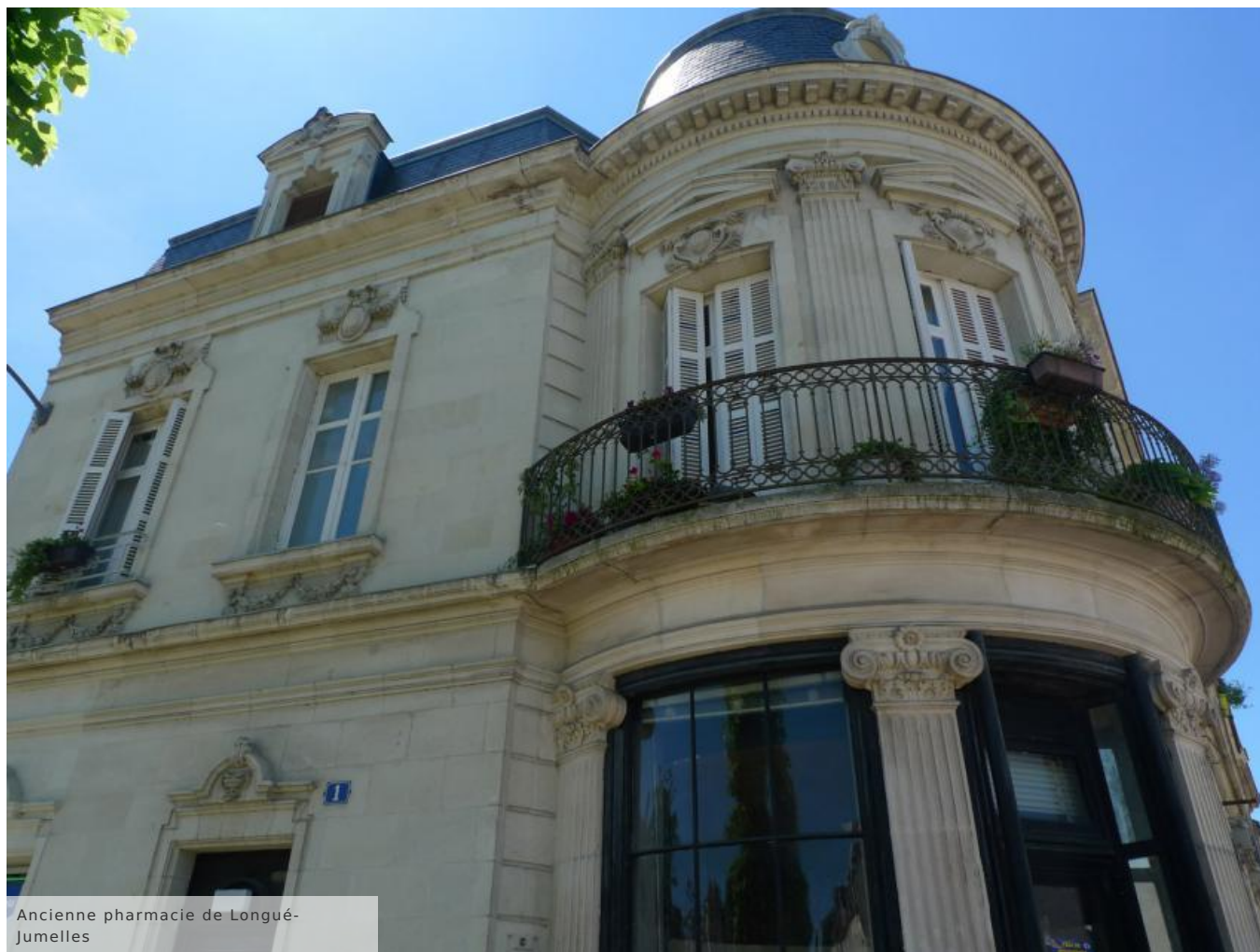
Ancienne pharmacie de Longué-Jumelles