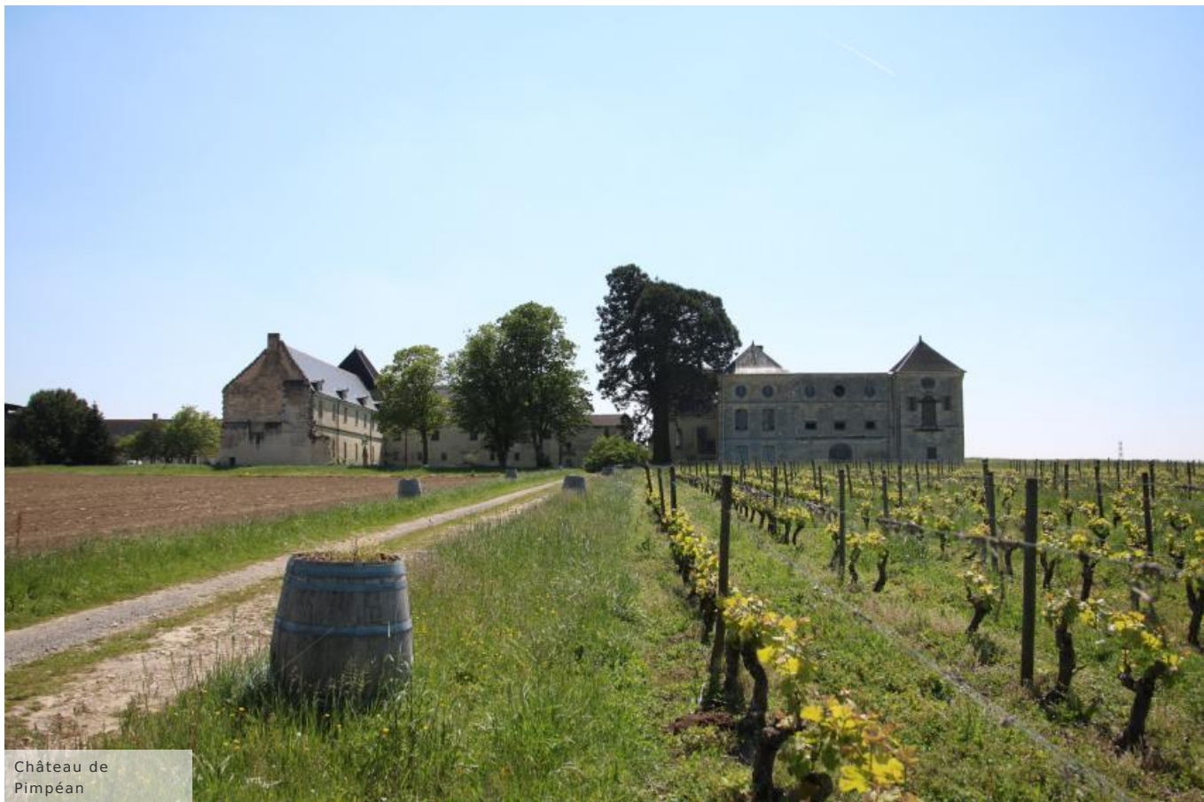
Château de Pimpéan