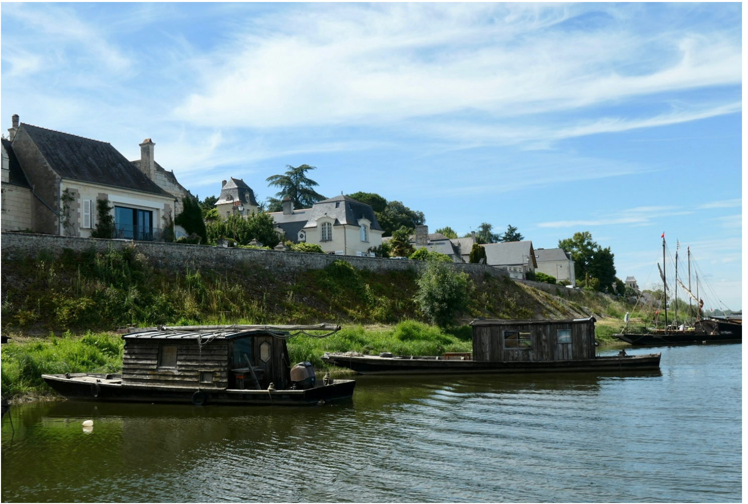
Toutes et futreaux amarrés au Thourel