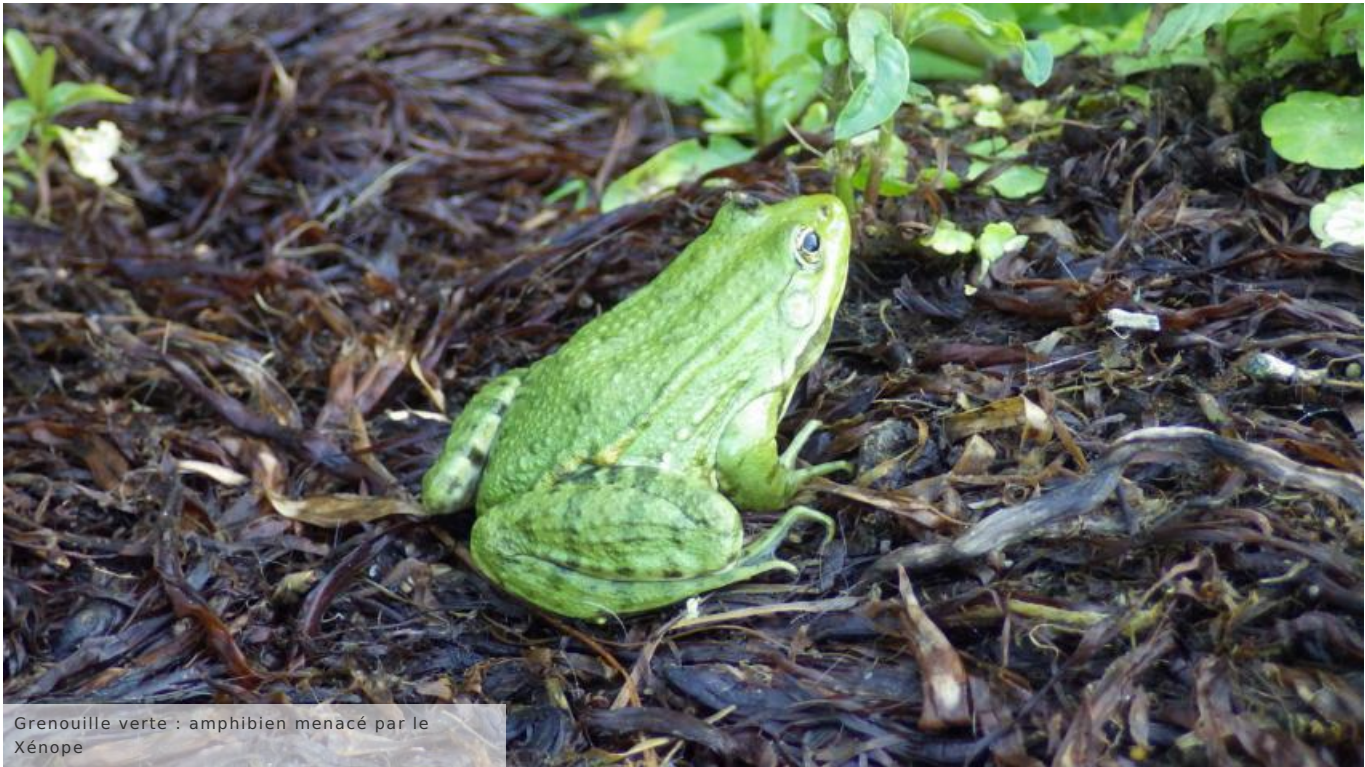
Grenouille verte : amphibien menacé par le Xénope