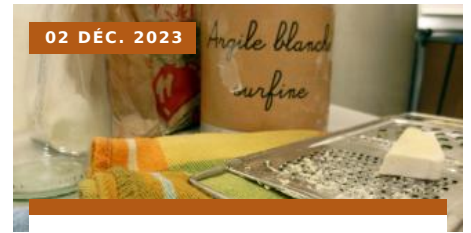
Table de fêtes