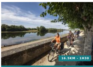
Au fil de l'eau - Circuit n°20