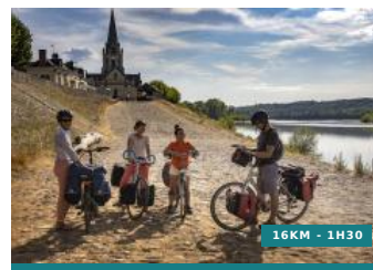
De port en port - Circuit