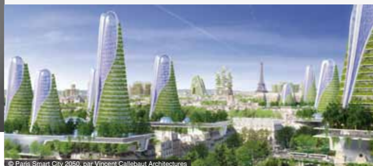
© Paris Smart City 2050, par Vincent Callebaut Architectures