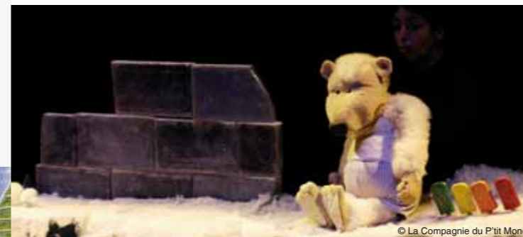
© La Compagnie du P'tit Monde

Spectacle de marionnettes de La Compagnie du P'tit Monde Tarif : 4 €, gratuit enfants - de 3 ans Réservation obligatoire au 02 41 38 38 88