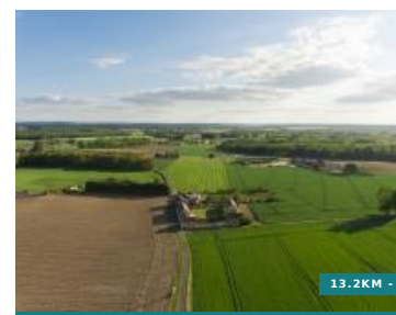
Entre Mâble et Veude - Circuit