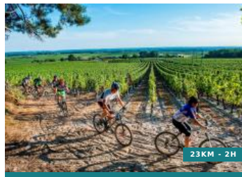
Entre vignes et forêts