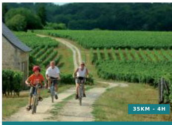
Entre forêts et clairières