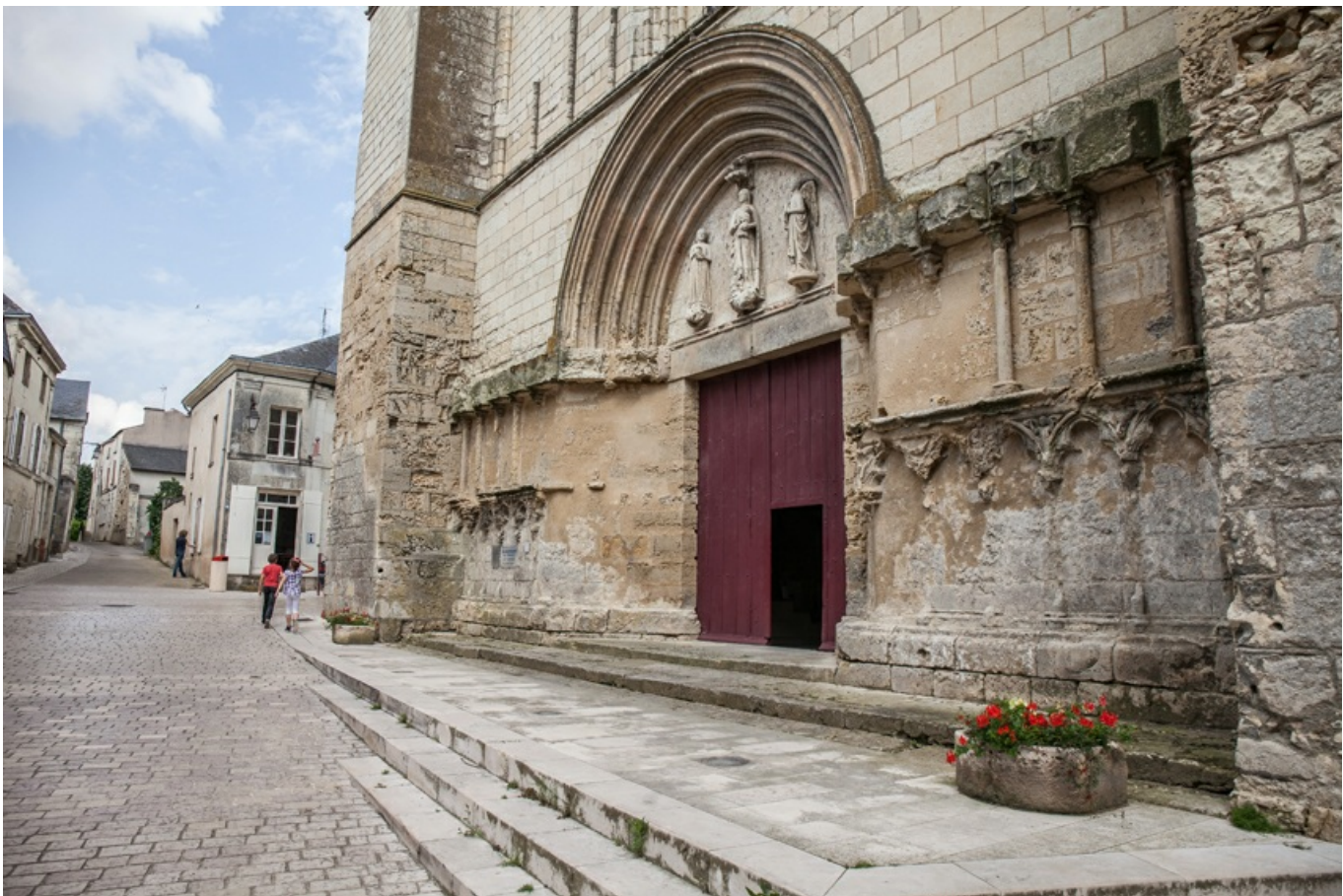
Tympan de la collégiale du Puy-Notre-Dame