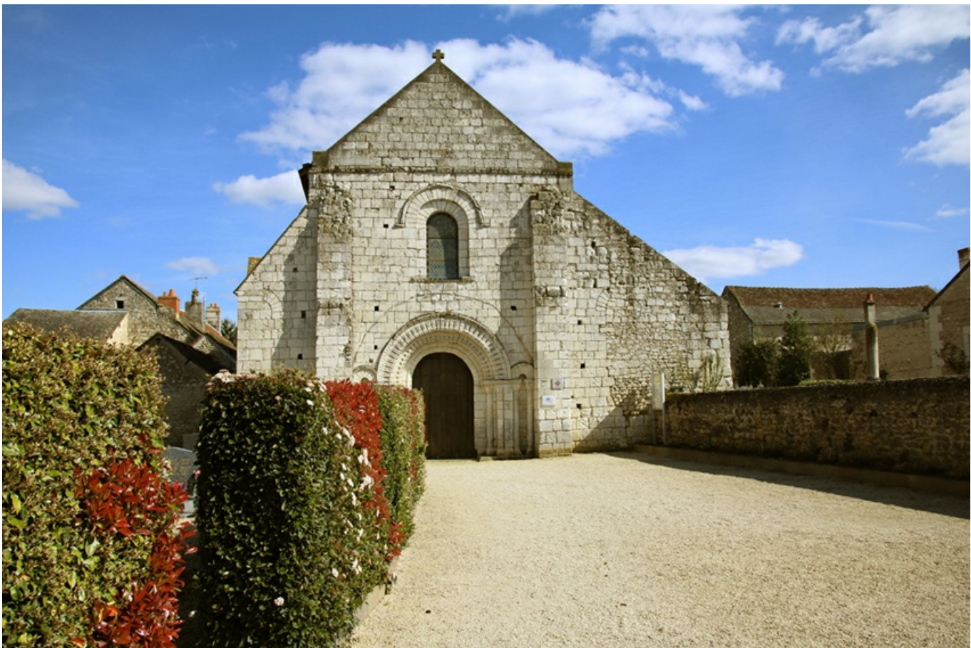
L'église de Tavant abrite une crypte datant du 12 e siècle