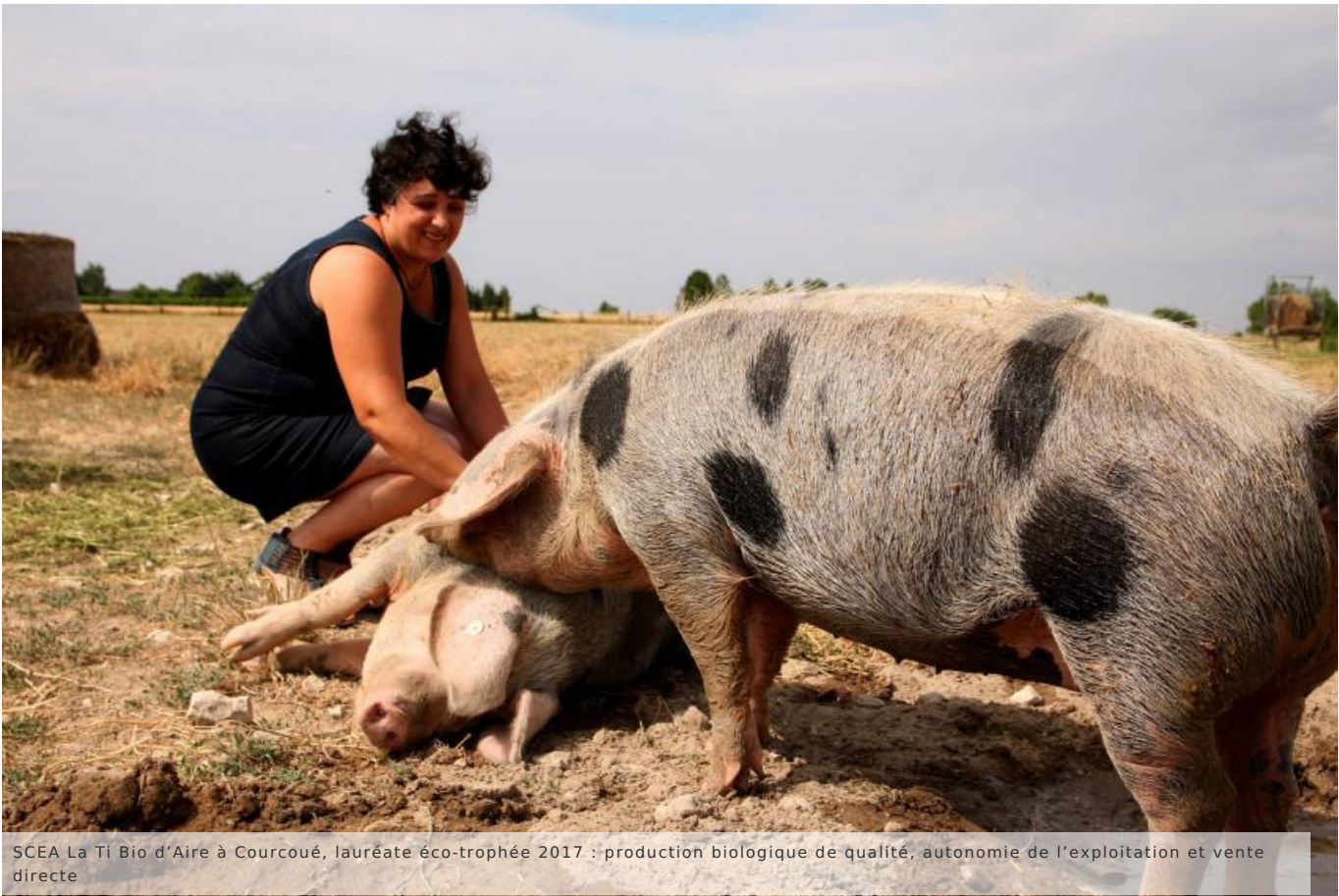
SCEA La Ti Bio d'Aire à Courcoué, lauréate éco-trophée 2017 : production biologique de qualité, autonomie de l'exploitation et vente directe