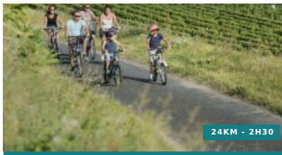
Entre val et coteau - Circuit n°31