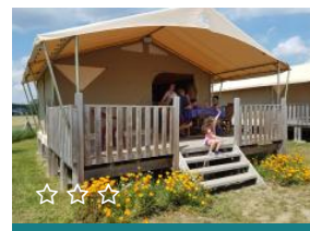
Loire et Châteaux

AGRICULTURE PLANTES & FLEURS Bréhémont Philippe LEPERE