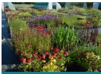
La palette végétale

AGRICULTURE PLANTES & FLEURS Bréhémont Philippe LEPERE