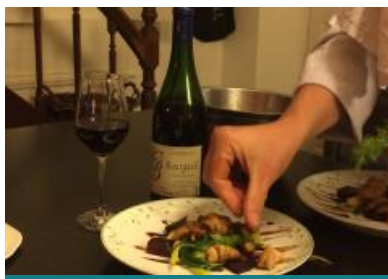
Vincent, cuisinier de campagne