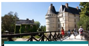
À l'ombre de romantiques châteaux et insolites troglos en vallée de l'Indre