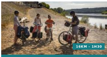
De port en port - Circuit n°19