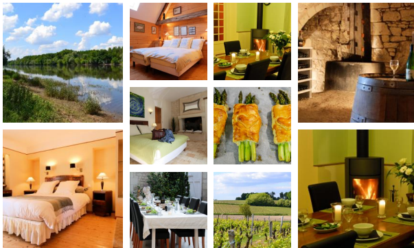
Table d'hôtes : 35€

Occupation des chambres pour une seule personne : -10€/nuit