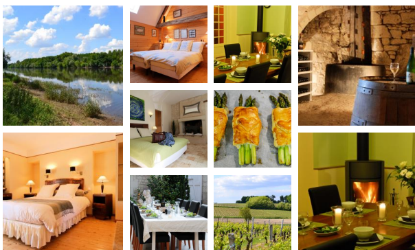
Table d'hôtes : 35€

Occupation des chambres pour une seule personne : -10€/nuit